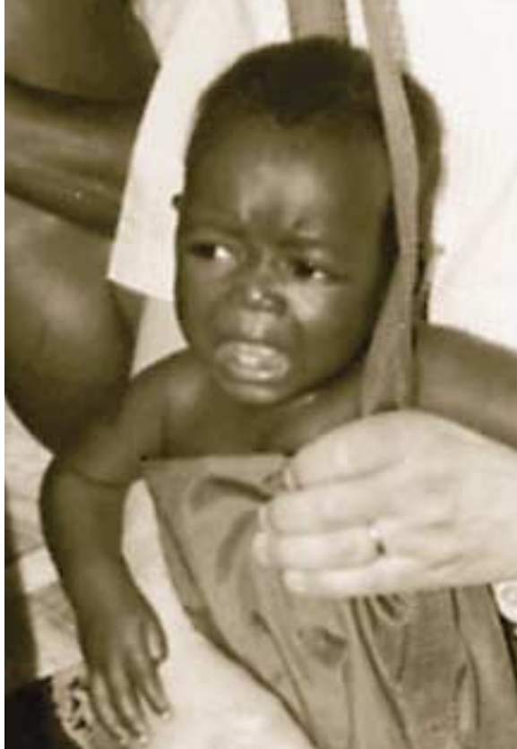
Cada vez son más las familias que utilizan los servicios de salud infantil en los poblados de Uganda comprendidos en el proyecto de nutrición y desarrollo en la primera infancia. Gracias al componente de difusión de información del proyecto, está aumentando notablemente la participación de la comunidad. La fotografía muestra cómo se pesa a un niño.

gama de servicios, que comprenden desde estudios de las condiciones para la inversión (en lugares tan diversos como la Federación de Rusia y Timor Oriental) y apoyo para el suministro de servicios de infraestructura por el sector privado hasta el otorgamiento de préstamos que tienen un efecto catalizador y medidas innovadoras de financiamiento (por ejemplo, la concesión de garantías).