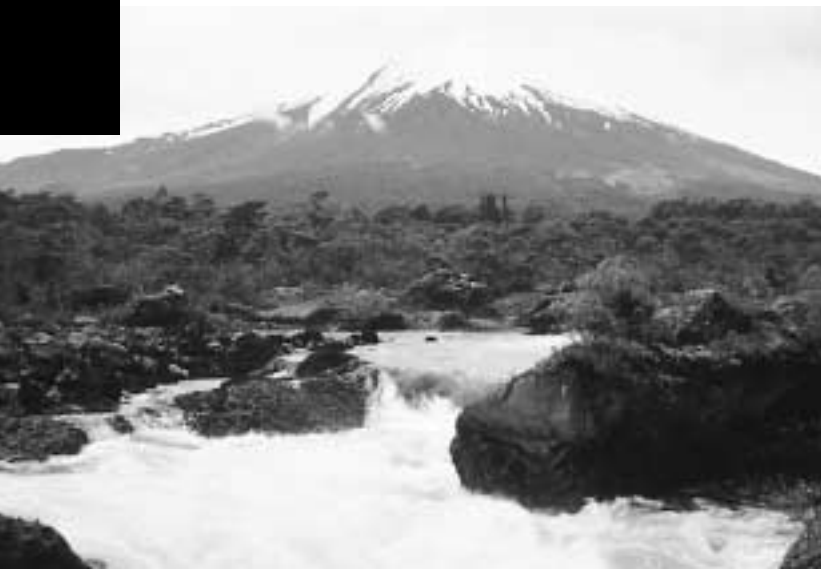
El Banco, uno de los tres organismos de ejecución del Fondo para el Medio Ambiente Mundial, presta asistencia a sus países miembros para que éstos conserven sus recursos naturales y los exploten de manera sostenible.

proteger la capa de ozono, descontaminar las aguas internacionales, frenar la degradación de la tierra y eliminar los contaminantes orgánicos persistentes. El FMAM es el mecanismo financiero encargado de la aplicación de los convenios sobre la diversidad biológica y los contaminantes orgánicos persistentes y la convención sobre el cambio climático.