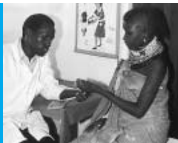
QUINTO OBJETIVO Mejorar la salud materna

Las investigaciones realizadas últimamente indican que la ayuda es eficaz cuando un país cuenta con una estructura de gastos y un marco normativo apropiados, instituciones sólidas y un sector privado dinámico, y cuando tanto las autoridades como la población están firmemente decididas a apoyar las reformas necesarias. También hay una clara conciencia de que la pobreza tiene un carácter multidimensional y de que los objetivos de desarrollo del milenio son interdependientes. El Banco reconoce que dos fuerzas importantes capaces de impulsar un crecimiento económico que beneficie a la gente pobre son el sector privado y los pobres mismos. En consecuencia, las prioridades estratégicas del Banco están basadas en dos pilares: establecer condiciones propicias para la inversión, crear puestos de trabajo y promover un crecimiento sostenible, por un lado y, por el otro, invertir en la gente pobre y potenciarla para participar en el desarrollo. Además, el Banco reconoce que algunos de los problemas de desarrollo más apremiantes trascienden las fronteras nacionales y deben encararse a escala mundial mediante esfuerzos coordinados internacionalmente. Para hacer frente a los múltiples problemas prioritarios y urgentes que se plantean en el mundo, como el suministro de bienes públicos mundiales, serán necesarios el mejoramiento de la gestión y el financiamiento de carácter multisectorial.