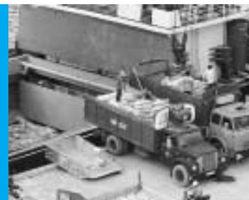
OCTAVO OBJETIVO Promover una alianza mundial para el desarrollo