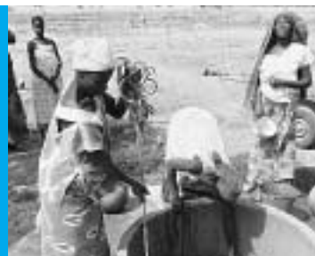
SÉPTIMO OBJETIVO Asegurar la sostenibilidad ambiental