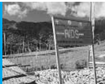
SEXTO OBJETIVO Combatir el VIH/SIDA, el paludismo y otras enfermedades